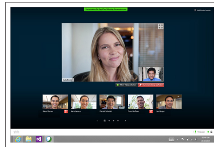
Abbildung 2: Vollbildmodus

Machen Sie es anderen noch einfacher, Sie über die WebEx Video Bridge in Ihrem persönlichen Raum zu treffen. Die Teilnahme an Ihrer Videokonferenz ist über ein beliebiges standardbasiertes Videosystem möglich.