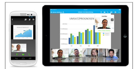
Abbildung 3: Meetings über jedes beliebige Gerät

Auch auf Android-Geräten, iPhones, iPads, sowie BlackBerry 10- und Windows Phone 8-Geräten stehen Ihnen umfassende Audio-, Video- und Inhaltsfreigabefunktionen zur Verfügung.